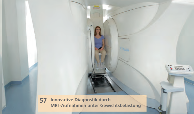
57 Innovative Diagnostik durch MRT-Aufnahmen unter Gewichtsbelastung