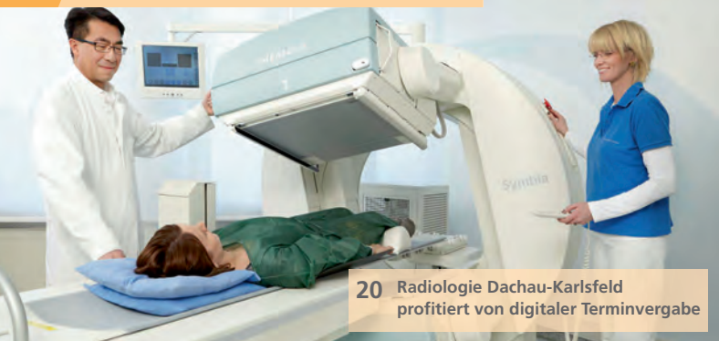
20 Radiologie Dachau-Karlsfeld profitiert von digitaler Terminvergabe