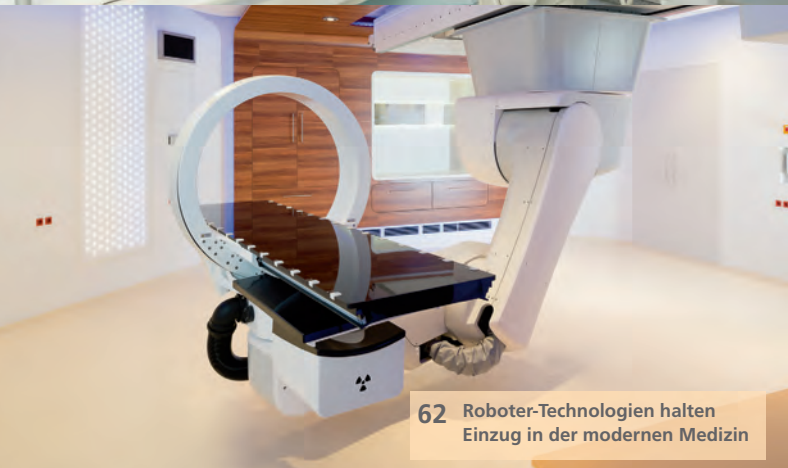
62 Roboter-Technologien halten Einzug in der modernen Medizin