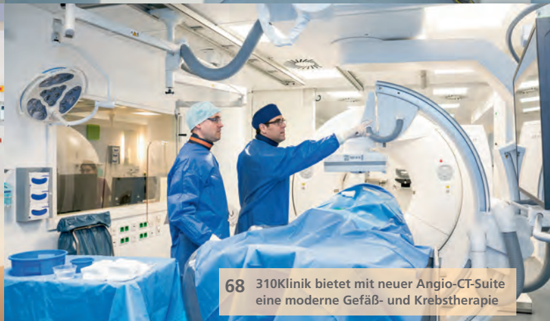
68 310Klinik bietet mit neuer Angio-CT-Suite eine moderne Gefäß- und Krebstherapie